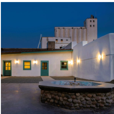
TOP ROW, LEFT TO RIGHT: Petersen House, Eisendrath House, Elias-Rodriguez House